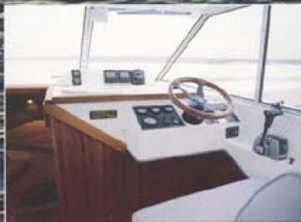
Förarplatsen har alla instrument inom bekvämt räckhåll. Sikten är föredömlig. Sjukortsäck framför ratten.