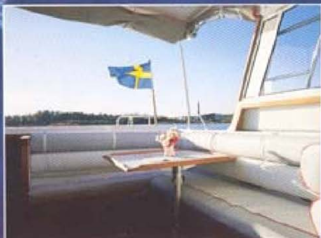
Vinkelsoffan i sittbrunnen rymmer ett helt sällskap. De sitter bekvämt vid bordet (som kan svängas undan) och har bra sikt ut runtom.