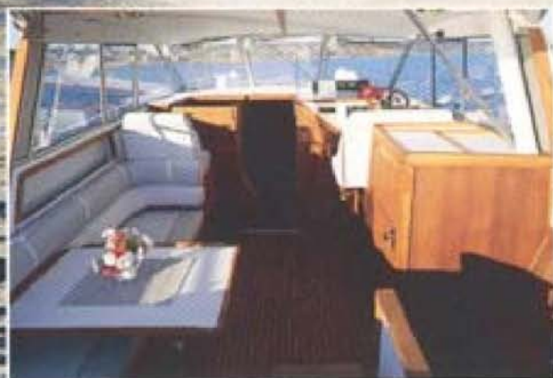
Inredningen sedd akterifrån. En riktig tränredning som ändå är ljus och luftig.