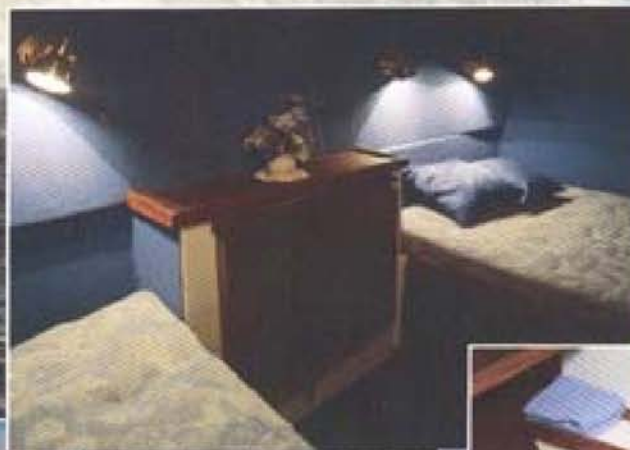
Akterruffen har en dubbel- och en singelkoj, plus garderob och stuvutrymme. Ett riktigt sovrum.