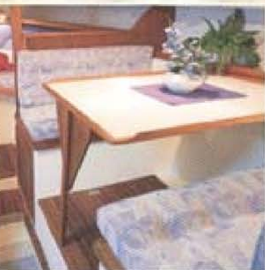
Peritrån. Om styrbord syns dnetten (samt som anas om babord) och längre borten längst fram.