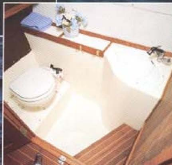
Toaletten mitt i båten, fullständigt avskild, har full ståhöjd och ordentligt svängrum.