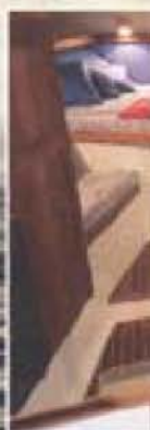
Ruffen sedd (mitt emot) föröver du...