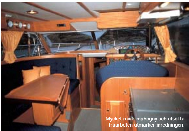
Mycket mörk mahogny och utsökta träarbeten utmärker inredningen.